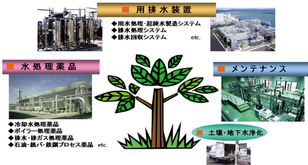
水処理の総合ソリューション（薬品、装置、メンテナンス）