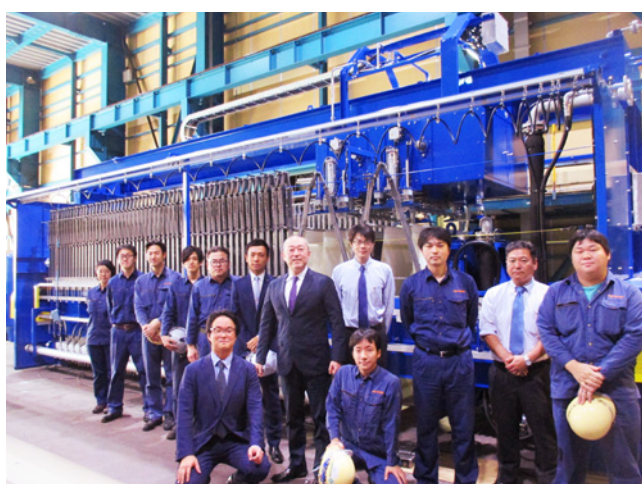
新商品開発プロジェクトメンバー