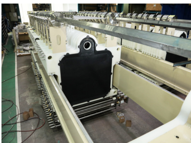
クリタ式ろ布走行型フィルタプレス