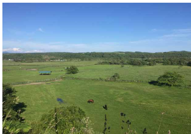
日高のお気に入りの風景