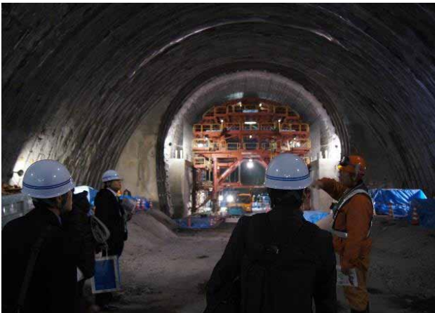
トンネル工事状況