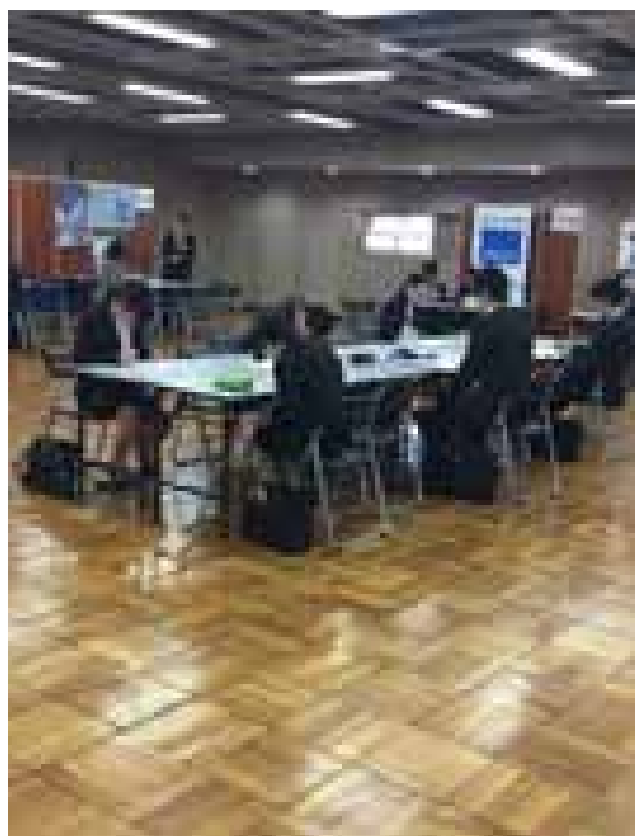
学生フリースペース