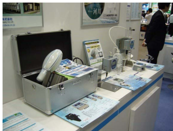
テーブルトップ展示2