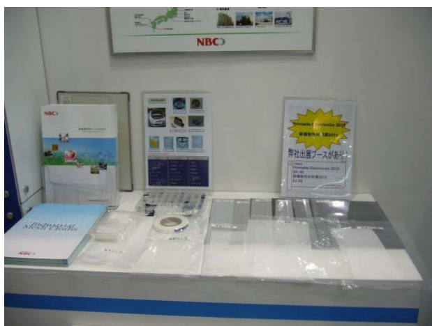
テーブルトップ展示1

そのため、当会のブース付近では周辺が閑散としていた。前回も決して良い位置では無かったが、近くにNEDOの大きな小間があり、客寄せをしている流れがLFPI小間に移動してくるなどの利点があり、当会のテーブルトップ展示も7社ほどあったためブースも大きく、勢いがあった。