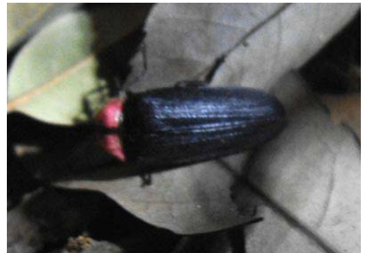
写真 ゲンジボタル

ここで日本のゲンジボタルに絞って説明しますと、体調は12~18mmで日本最大のホタルでメスのの方が大きいです。ホタルのお尻が光っている箇所を発光器と云いますが、オスは2つ、メスは1つでオスの方が明るく見えます。また、空中で飛んでいるのはほとんどがオス、メスは草むらの影に身を潜めています。オスはメスの光を求めて、飛び回っているのです。