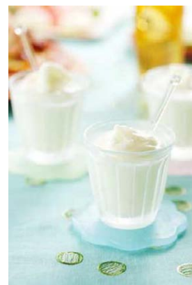
ラッシージェラート

アイスクリームより脂肪分が少ないヘルシーな氷菓です。プレーンなラッシーの味の次はお好みの果物を加えてみては？