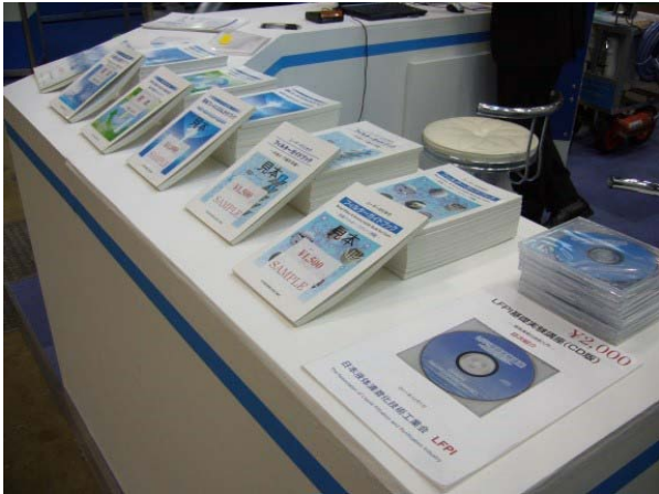
書籍の販売コーナー

LFPIの小間では書籍の販売を中心に宣伝活動を行ったが、前回の56冊に対し、今回は10冊の売上に留まった。しかし、当会のホームページからも書籍が購入出来る事を伝え、会場で重い書籍を持ち歩く必要が無い、HPからの購入を決めた人もいたようだ。又、会員企業のパネルを見る人も多く、当会に興味があり、会員になって情報交換をしたいなどと話す近くのブースの責任者もおり、閉会間際になって当会のカタログを送って欲しいなどと言って来る来場者もいた。その点では、多くはないが当会に興味を持っている潜在的な客層もいるという事を感じた。