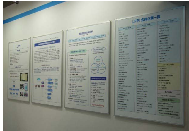
パネル展示コーナー

又、反対側の東4ホールから東6ホールは、nano techを中心に3D Printingなどの小間があり人気を呼んでいた。やはりこの時期はnano techを中心に来場者が動いているように思われた。当会もインターアクアへの出展は初回から参加しているが、この現状が変わらない限り、来期に出展するかは考え直さないといけないと感じている。