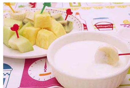
練乳ヨーグルトフォンデュ

フルーツを一口大にカットしプレーンヨーグルトと加糖練乳を加え混ぜたものにつけて食べます。ホームパーティーなどにも最適です。