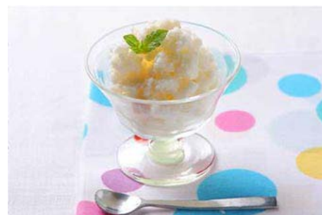
梅酒ヨーグルトのシャーベット

プレーンヨーグルトと砂糖と梅酒を加えよくかき混ぜます。密閉容器に入れ冷凍庫に入れます。固まりかけたらかき混ぜ冷凍庫に入れこれを2~3回繰り返したら出来上がりです。空気を含ませるように削りながら全体をかき混ぜるのがコツです。